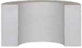
Yarım izolasyon kasnakları