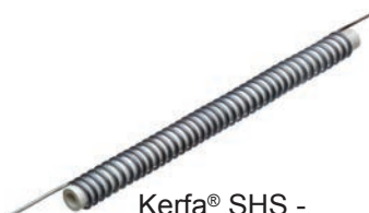
Kerfa® SHS - resistenza di riscaldamento sul sostegno ceramico a tubo