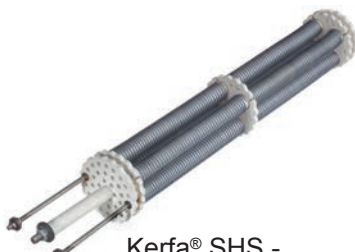
Kerfa® SHS - gabbia di resistenza in bobina

La vasta gamma di soluzioni innovative di Kerfa® è composto da: