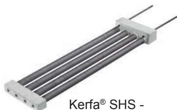
Kerfa® SHS - resistenze a spina