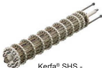
Kerfa® SHS - resistenze ingabbiate