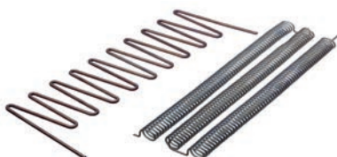
Kerfa® SHS - resistenze (formate) / resistenze a spirale